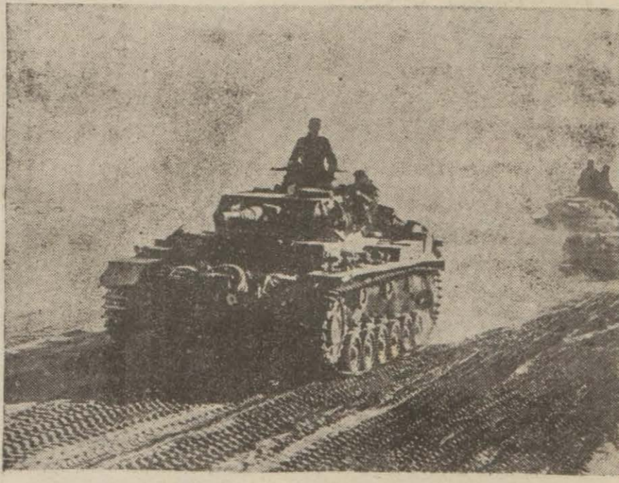
Şimali Afrika hareketine iştirak eden Alman tankları

Londra 26 (A.A.) — İngiliz hava nazirliğinin tebliği: Dün gece ana vatan hava kuv- vetlerinin bütün hareket şubelerine başlı tayırelerimizden pek büyük teşkiller tam bir faaliyet halinde bu- kunmuşlardır. (Devamı 5 inci sayfada)