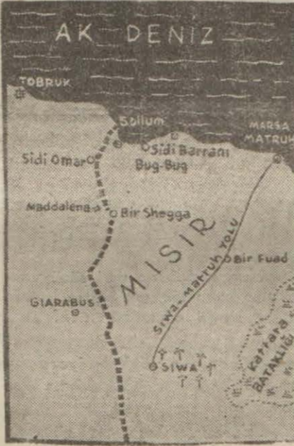
Marsa Madrah'u gösterir harita (Yazısı 5 inci sayfada)

Mihver kıt'aları doğuya doğru ilerliyorlar